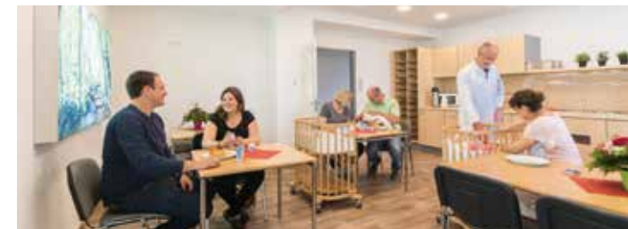
Frühstücksraum mit reichhaltigem Buffet

Am Morgen erwartet Sie ein leckeres Frühstücksbuffet im Frühstücksraum der Station. Sobald Sie möchten, können Sie dieses in Anspruch nehmen. Als kostenpflichtige Wahlleistung bieten wir auch Ihrem Partner die Teilnahme am Frühstücksbuffet an. Fragen Sie bitte unsere Mitarbeiterinnen der Station.