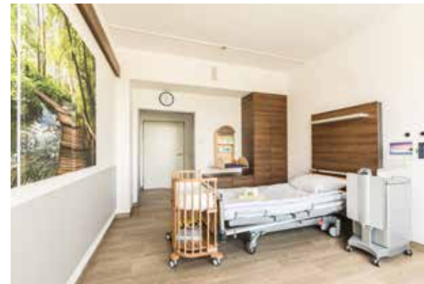
Komfort-Wahlleistungszimmer als Zweibett - und Einzelzimmer