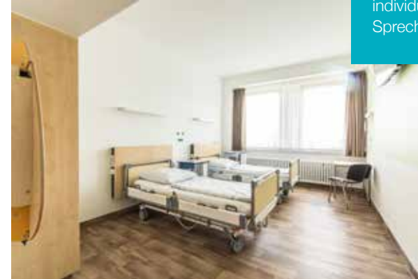
Zimmer in unserer neu umgebauten Geburtshilfestation

Mit unseren Zimmervarianten möchten wir Ihnen die passende Lösung für Ihre individuelle Situation anbieten. Sprechen Sie uns einfach an.