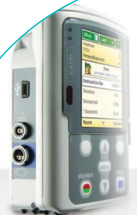
Eine Schmerzpumpe der Firma Smith Medical

Wir wünschen Ihnen einen möglichst schmerzfreien Krankenhausaufenthalt und eine gute Genesung. Kommen Sie auf uns zu – wir sind gern für Sie da und werden gemeinsam einen Weg zur Schmerzlinderung für Sie finden.