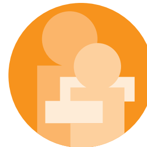
MS-Zentrum nach den Vergabekriterien der DMSG, Bundesverband e.V.