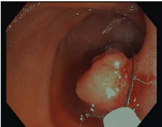
Abb.2: Karzinom im Ileum