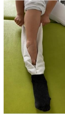
Fuß über das Handtuch in den Socken einschieben