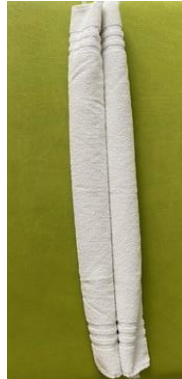
Handtuch von beiden Seiten einrollen