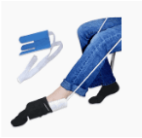
Anziehhilfe aus dem Sanitätshaus

Bei eingeschränkter Hüftbeugung gibt es folgende Hilfsmöglichkeiten