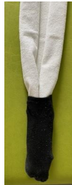
Socken über das Handtuchende ziehen