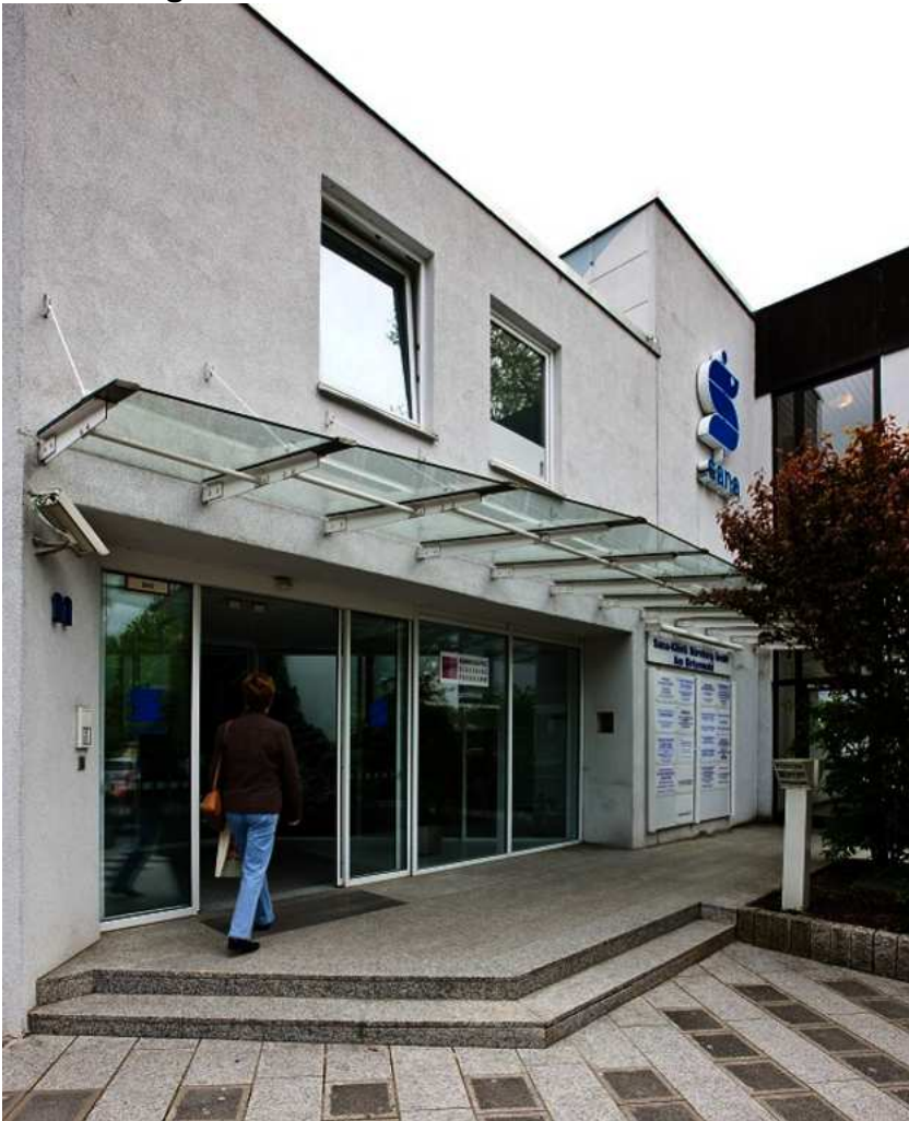
Abbildung: Die heutige Sana-Klinik Nürnberg hat im Gebiet der Birkenwaldanlage, im Südwesten Nürnbergs, eine über 40-jährige Tradition. Seit 1988 gehört die Klinik am Birkenwald zur Sana Kliniken AG, München.

In der Sana-Klinik Nürnberg sind die medizinischen Fachdisziplinen Allgemein Chirurgie, Unfallchirurgie/Orthopädie, Hand- und Fußchirurgie, Gynäkologie, Hals-Nasen-Ohrenheilkunde, Innere Medizin sowie multimodale Schmerztherapie vertreten. Sie werden unterstützt durch Fachärzte für Anästhesiologie, durch Radiologen, Nuklearmediziner, Strahlentherapeuten und durch Physiotherapeuten. Die Sana-Klinik Nürnberg gehört zur Sana-Kliniken AG.