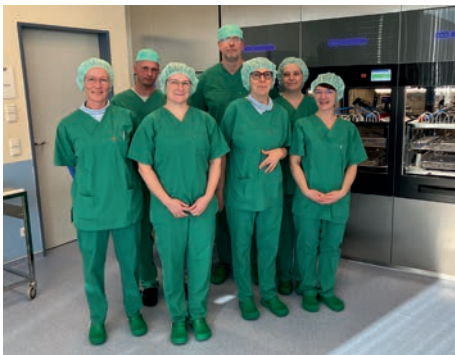
Das Team der Sterilisationsabteilung

Bereits im November 2024 wurden die zwei Sterilisatoren ausgetauscht, gefolgt von drei Reinigungs- und Desinfektionsgeräten im Januar 2025. Während