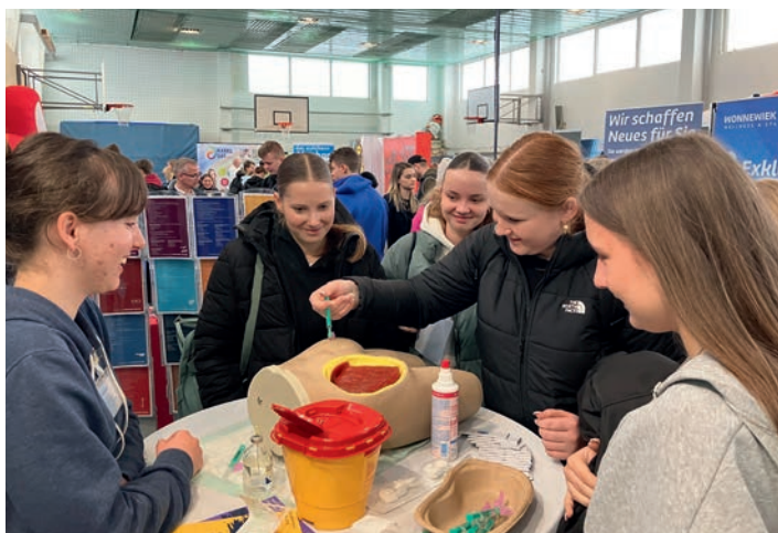
Schülerinnen üben Spritzen

Am 26. März 2025 zog die Berufsmesse Rügen unter dem Motto „Finde deinen Traumjob direkt neben deiner Haustür“ zahlreiche interessierte Schüler der Klassenstufen 8 bis 10 von Rügen und Stralsund an. Die Veranstaltung bot spannende Einblicke in verschiedene Ausbildungsberufe der Region und eröffnete den Jugendlichen Perspektiven für ihre berufliche Zukunft.