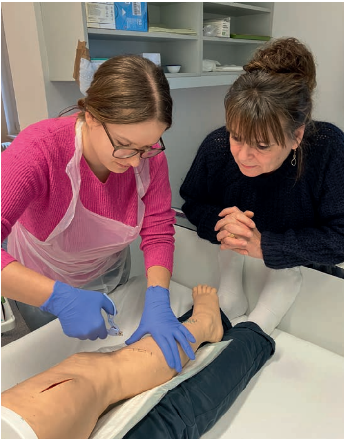
Übung an einer unteren Extremität

wichtig, die Theorie mit praxisnahen Lernmethoden zu verbinden. Ein zentraler Bestandteil der Ausbildung ist deshalb der fachpraktische Unterricht. Hier werden nicht nur Pflegetechniken vermittelt, sondern die Grundlage dafür gelegt, dass die Auszubildenden im späteren Berufsalltag sicher und kompetent handeln können.