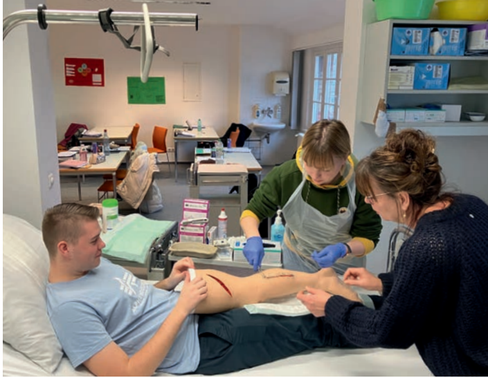
Praktische Übung: Wundfäden ziehen

erproben. Die Schüler erhalten nach jeder Übung ein persönliches Feedback von der Kursleitung und haben so Gelegenheit, eventuelle Unsicherheiten abzubauen.