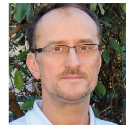
Marek Karkus Physiotherapie/ Lokomotionstherapie

»Die Schule für Kranke unterrichtet Patienten im Schulalter auch im Bereich der basalen Förderung und berät über Möglichkeiten und Grenzen der Unterstützten Kommunikation (UK).«