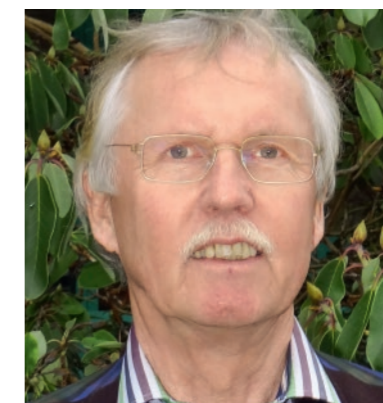
Gerhard Hornicek Schule für Kranke und Beratungsstelle für Unterstützte Kommunikation

»Die instrumentelle Ganganalyse hilft bei der Versorgung und Therapie von komplexen Gangstörungen, deren Ursache in der medizinischen Untersuchung nicht sicher gefunden werden kann.«