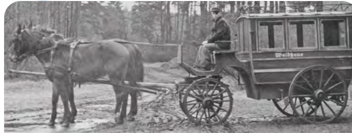
Die berühmte „Bazille“. So nannten die Patienten das Coupé des Waldhauses Charlottenburg, welches sie vom Bahnhof Beetz-Sommerfeld in die Klinik brachte.

Ein Idyll des Landlebens soll das gesunde Pendant zur tückischen Großstadt bilden. Bereits die Vorstellung von dieser angeblichen Alpenidylle kehrt die ängstliche Erwartung des Anstaltsaufenthaltes in ein positiveres Empfinden.