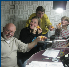
3 Königs-Lotterie: Spaß bei Hörern und Team