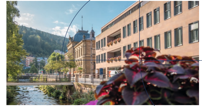
MVZ im Herzen der Kurstadt Bad Wildbad