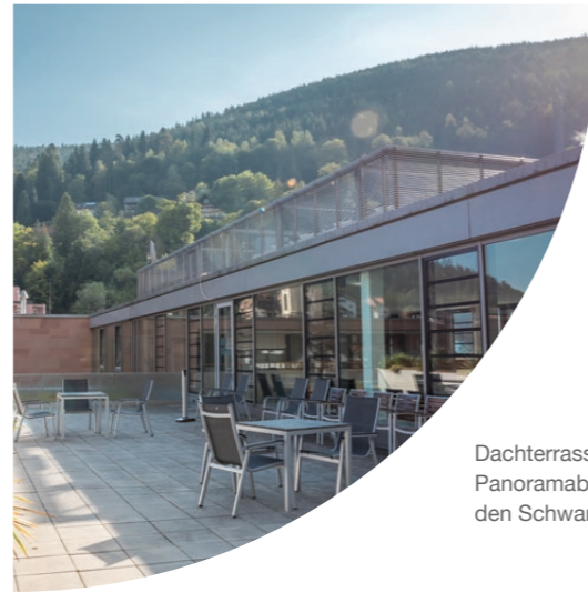
Dachterrasse mit Panoramablick auf den Schwarzwald