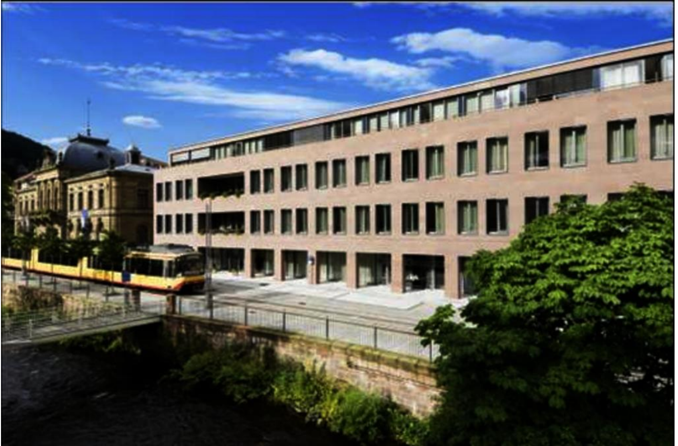
Abbildung: Das Sana Gelenk- und Rheumazentrum Baden-Württemberg ist ein überregionales Zentrum für rheumatische Erkrankungen ergänzt um die Innere Medizin. Beim Ersatz von Hüft- und Kniegelenken bietet das EndoProthetikZentrum höchste Qualität.

Das Sana Gelenk- und Rheumazentrum Baden-Württemberg ist ein überregionales Zentrum für die Diagnostik und Therapie rheumatischer Erkrankungen. Ergänzt wird dieses ganzheitliche Konzept durch die Sana Klinik für Innere Medizin - insbesondere bei allgemein-internistischen Fragestellungen. Beim Ersatz von Hüft- und Kniegelenken bietet das EndoProthetikZentrum höchste Qualität.